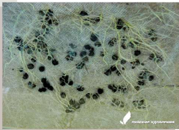
Фото 1. Развитая корневая система сформировалась вокруг гранул ОМУ. В их составе 35% - 55% минеральной составляющей.