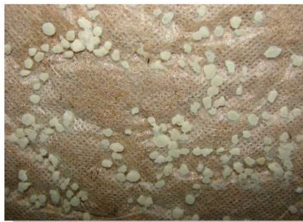
Фото 2. Корневая система этого же растения в зоне гранул отсутствует. Она была остановлена повышенной концентрацией почвенного раствора за 5 - 7 см до минеральных гранул.

ОАО „БУЙСКИЙ ХИМИЧЕСКИЙ ЗАВОД” 157003, г.Буй, Костромская область, ул. Чапаева, д.1 Тел.: +7 (49435) 4-41-41 www.bhz.ru